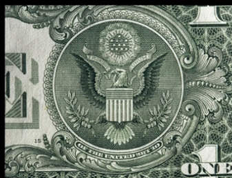
Dollaro geneticamente modificato, 2005©